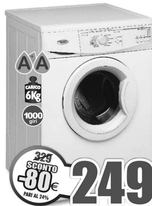
WHIRLPOOL AWO/D6106 Lavatrice carica frontale, carica 6 kg, centrifuga 1000 giri, classe A+/A di efficienza energetica e lavaggio, programmi: Rapido 30', Lana, Lavaggio a mano, sistema di controllo Easy Plus, regolazione automatica dei consumi

A8 VISION AMD QUAD CORE AMD RADEON™ DUAL GRAPHICS