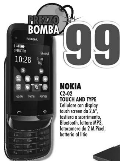
NOKIA C2-02 TOUCH AND TYPE Cellulare con display touch screen da 2,6", tastiera a scorrimento, Bluetooth, lettore MP3, fotocamera da 2 M.Pixel, batteria al litio