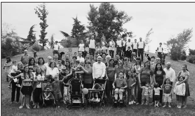
Ricordo della festa dell'associazione "Un sorriso di speranza" al Ristorante Daps.

Rifacendosi alla convinzione di Gandhi che "nessun uomo è inutile se allevia il peso di qual-