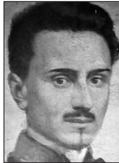
Ippolito Nievo (Padova 1831 - Mar Tirreno 1861).

Ma le Confessioni sono soprattutto un inno alla speranza, quella di unire una nazione separata da grandi stranieri e pic-