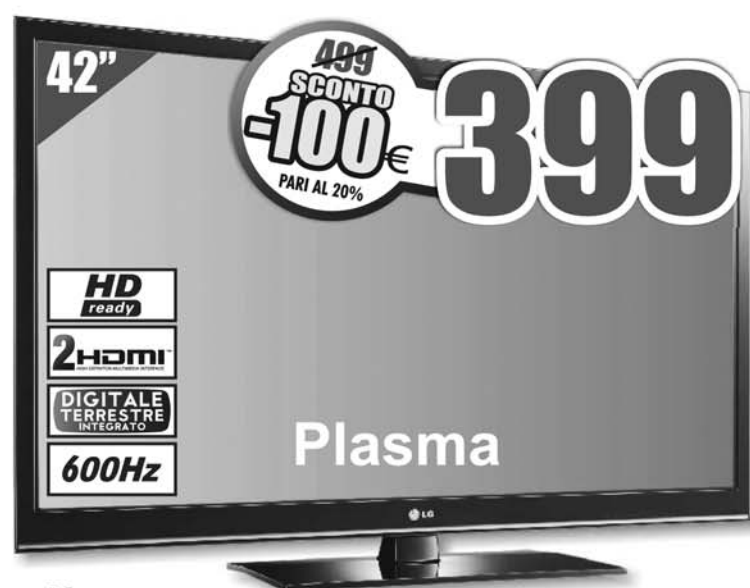
LG - 42PT353A TV al plasma 42" HD READY, risoluzione 1024x768, 600 Hz, decoder digitale terrestre integrato in alta definizione, 2 HDMI, USB 2.0 (video, musica, foto)