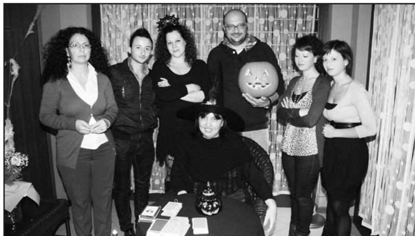
Ricordo della serata con la cartomante.

All'interno del locale è stato predisposto uno spazio per una "cartomante stregata" che ha letto le carte a diverse decine di giovani che, diligentemente in