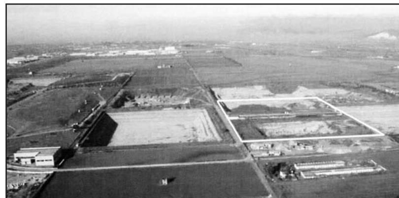
Il progetto della nuova discarica richiesto da Padana Green srl.