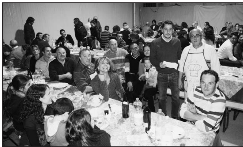
La consegna della busta da parte degli organizzatori.