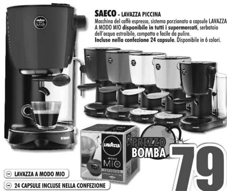
SAECO - LAVAZZA PICCINA Macchina del caffè espresso, sistema porzionato a capsule LAVAZZA A MODO MIO disponibile in tutti i supermercati, serbatoio dell'acqua estraibile, compatta e facile da pulire. Insieme nella confezione 24 capsule. Disponibile in 6 colori.