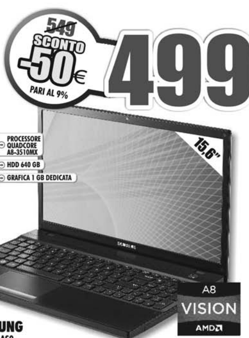
SAMSUNG NP305V5AS0 Notebook, APU AMD Quad-Core A8-3510MX con grafica AMD Radeon™ HD 6640G2 Dual Graphics, 1 GB DDR3 dedicato, Hard Disk 640 GB, 4 GB RAM, DVD±R±RW SM DL, display 15,6", Wi-Fi, HDMI, Webcam, Bluetooth® 3.0, Windows® 7 Home Premium

Scarica gratuitamente l'esclusiva App Trony per iPhone, iPad e Android!